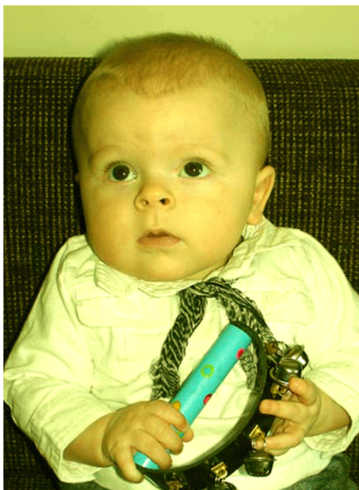
Mini Bronson kom til verden den 27. september 2005